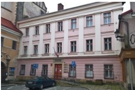
Obrázek č. 1: Budova MěÚ - OSVZ, OSPOD, nám. Československé armády č.p.3

Výkon sociálně-právní ochrany dětí (dále jen SPOD) je zajištěn v přízemí budovy Městského úřadu Jaroměř (dále jen MěÚ), na adrese nám. Československé armády č.p.3. Necelých 100 m, na adrese nám. Československé armády č.p.16, se nachází hlavní budova MěÚ. V přízemí této hlavní budovy je podatelna, kde jsou zaměstnanci připraveni poskytnout základní informace, předat kontakty na zaměstnance zařazené pod oddělení sociálně-právní ochrany dětí a nasměrovat je na Odbor sociálních věcí a zdravotnictví (dále jen OSVZ) a Oddělení sociálně-právní ochrany (dále jen OSPOD). V blízkosti je dostatek parkovacích míst. Prostory OSPOD v Jaroměři jsou částečně bezbariérové.