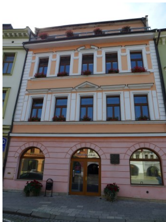
Obrázek č. 2: Hlavní budova MěÚ, nám. Československé armády č.p.16